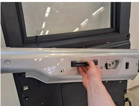
Otan oven paneeli pois.