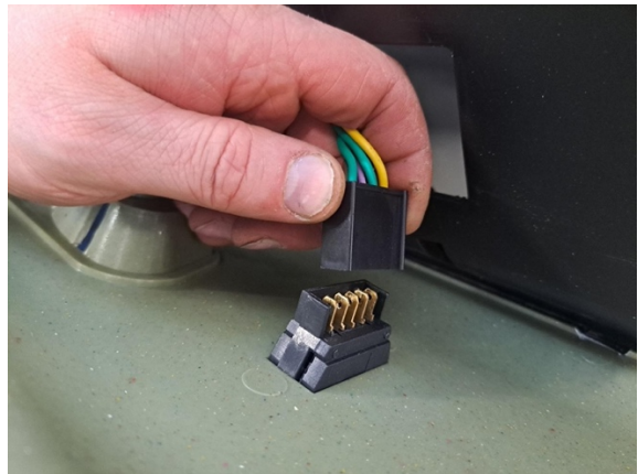
Irrota lasin nostinkytkimen liitin.