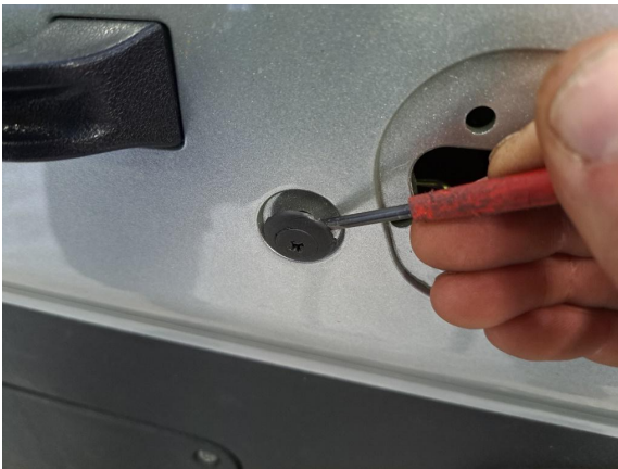
Raota kiinnitysklipsua (pieni talttameisseli) ja irrota kiinnitysklipsu. (muovinen sorkkarauta).