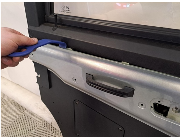
Kampea oven paneeli pois. (muovinen sorkkarauta).